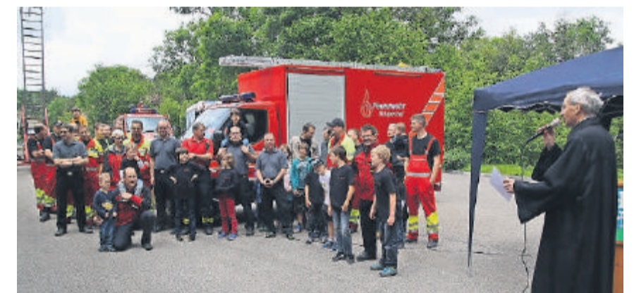
Im Beisein der Angehörigen der Feuerwehr wurde der Rüstwagen eingeseignet. EW

Wenn ein Notfall ansteht, ist schnelles Handeln gefragt. Bei der Feuerwehr stellt sich jeweils auch die Frage, welcher Art der Einsatz ist. Brennt es? Ist die Ölwehre gefragt? Oder benötigt jemand eine technische Hilfeleistung? Stets das richtige Hilfsmaterial dabei zu haben, verlangt gute Koordination und entsprechende Materialbehälter. Im Fall der Feuerwehr sind das sogenannte Module, auch Rollwagen genannt. Für die Feuerwehr Murgenthal war es an der Zeit, ein neues Logistikfahrzeug anzuschaffen. Der Rüstwagen aus dem Jahr 1990 wurde vom neuen «Iveco Daily» abgelöst, nicht aufgrund des Dienstalters des Fahrzeugs, sondern aufgrund des technischen Fortschritts in den vergangenen Jahrzehnten. Das neue Logistikfahrzeug verfügt über eine Hebebühne. Das gewährleistet, dass die erwähnten Module ohne Probleme auf die Ladefläche des Fahr-