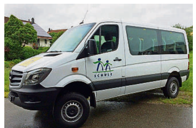
Der neue Schulbus der Primarschulgemeinde Weinfelden.

Am 2. Juni durfte die Schulbusfahrerin der Primarschule Weinfelden, Raphaela Helg Zahnd, die Schlüssel zum Mercedes Sprinter mit 21 Sitzplätzen in Empfang nehmen. (red.)