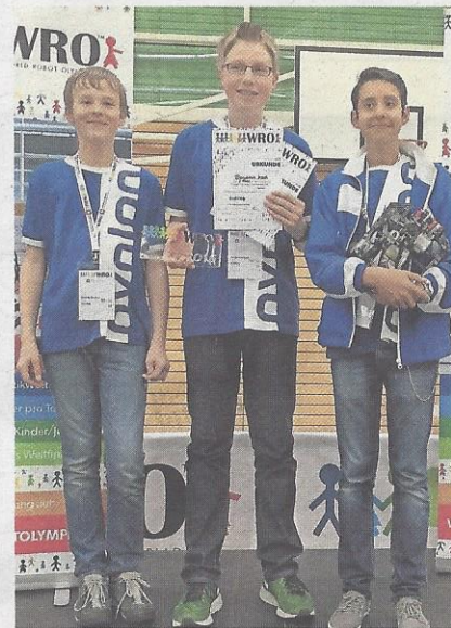
Kategorie Junior: 3. Rang Team avalog (Aarau).

Bei der Aufgabe der Altersklasse Senior (16 - 19 Jahre) galt es mit dem erfundenen Roboter, den Abfall in die Recyclinganlage zu bringen und in die entsprechenden Recyclingcontainer zu sortieren. Ausserdem sollten die ursprünglichen Sammelbehälter für den erneuten Einsatz vorbereitet und sortiert werden. Die Überraschungsaufgabe, die erst am Wettbewerbstag bekanntgegeben wurde, reizte viele Teams an, zusätzliche Punkte zu holen.