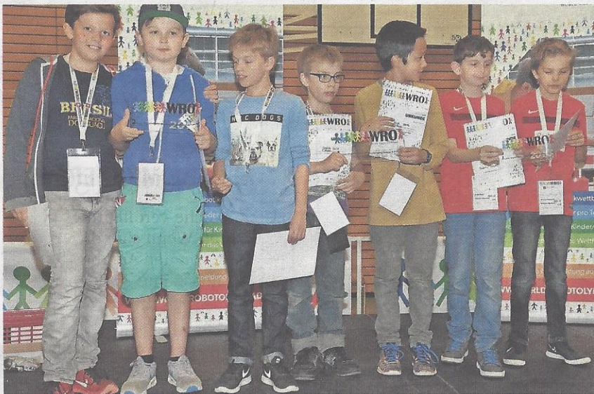
Kategorie Elementary: Links 1. Rang Team Legochlötzli (Aarau), Mitte: Team Legochlötzli 2 (Aarau), Rechts: 3. Rang Team Robotic Masters (Veltheim).

An den Wettbewerbstischen herrschte ein sportlicher Nervenkitzel. Freude und Enttäuschung lagen oft nahe beieinander, wenn die Roboter gestartet wurden und die Teams angespannt auf ihre Roboter blickten, um zu beurteilen, ob diese die Aufgaben erfolgreich zu lösen vermochten.