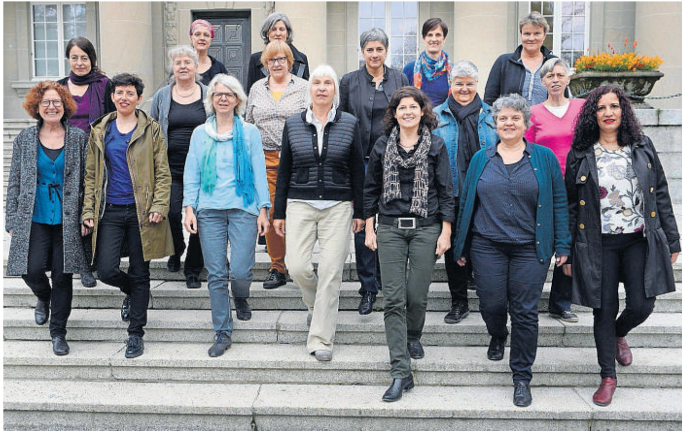
Die Politische Frauengruppe setzt sich im Parlament für die Gleichbehandlung aller Menschen ein.

Unter Gleichberechtigung versteht die PFG mehr, als nur genderspezifische Unterschiede auszumachen. Sie möchte sich auch für die politische Partizipation von Ausländern stark machen. Ausländerinnen und Ausländer sollen ebenfalls das Wahl- und Stimmrecht erhalten. Grüne Themen gehören ebenfalls ins