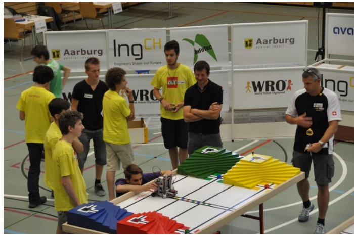
Teams RoBoLiBe 1, 2, 3

In der Altersklasse Junior gewann das Team Flobotik 1 aus Chur (1. Rang) vor dem Team avaloq aus Aarau (2. Rang) und den Ägeritalers aus Oberägeri (3. Rang).